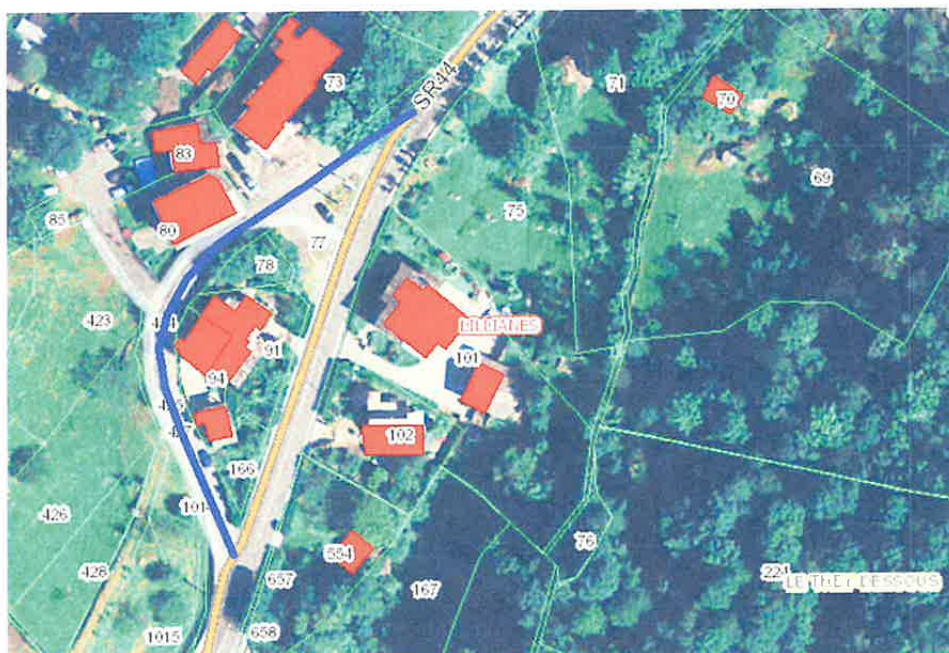
estratto da GeoNavigatore progetto SCT – Regione Autonoma Valle d'Aosta comune di Lillianes - dalla progressiva chilometrica 7+405 alla progressiva chilometrica 7+495

— tratto di strada da declassificare dalla progr. km. 7+405 alla progr. km. 7+495